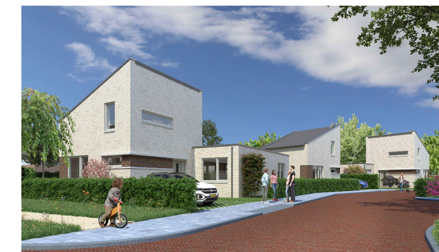
Nieuwbouw van 20 woningen aan de Havendijk, te Oudenbosch